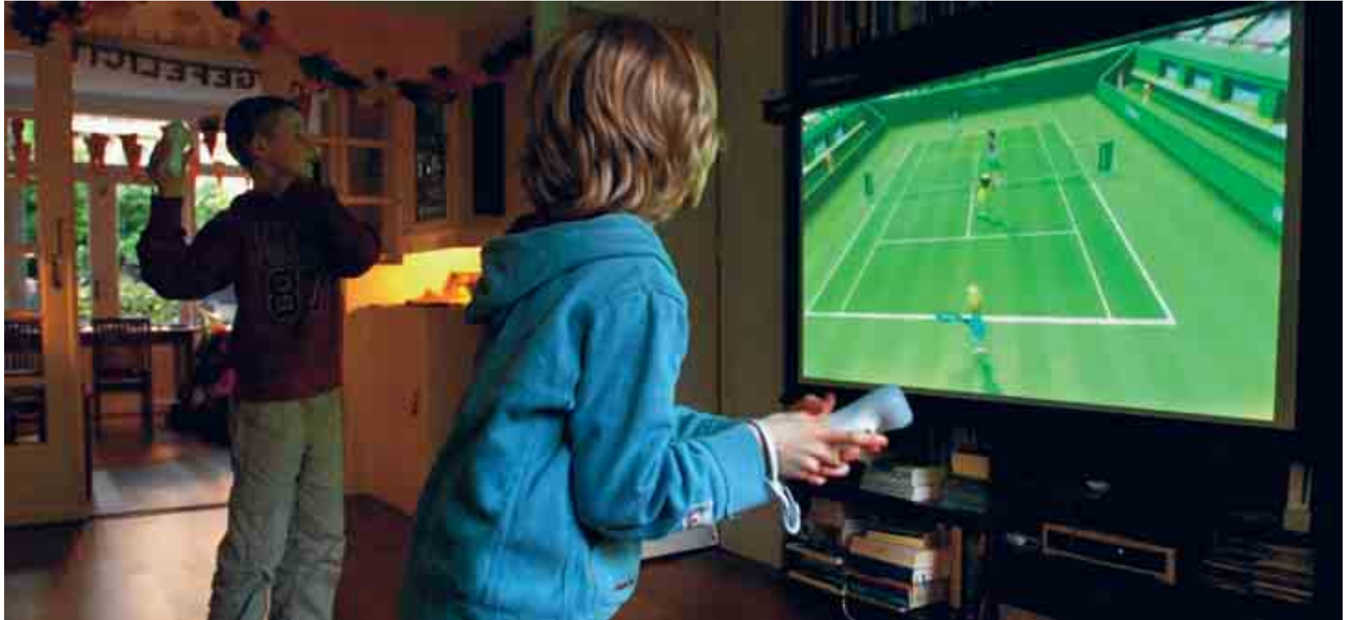
Wie met de Wii-console speelt, moet met de afstandsbediening tennis-, golf- of boksbewegingen simuleren.